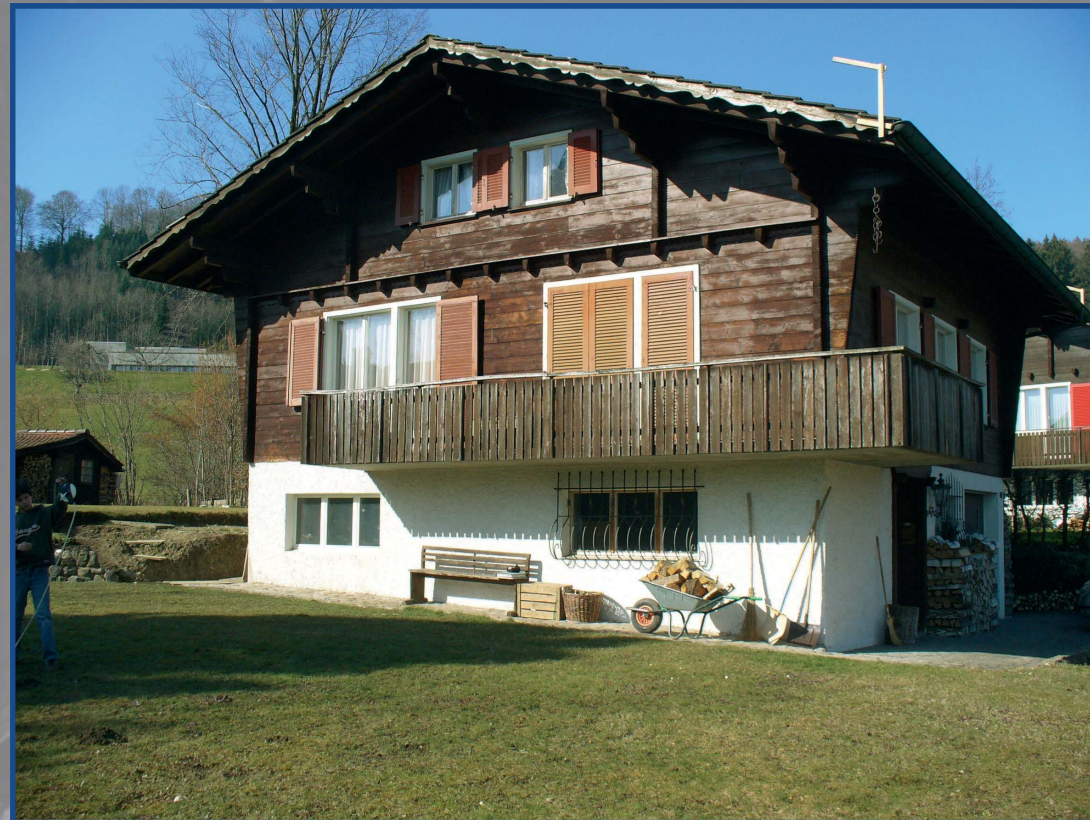
Das Haus vor der Sandstrahlung