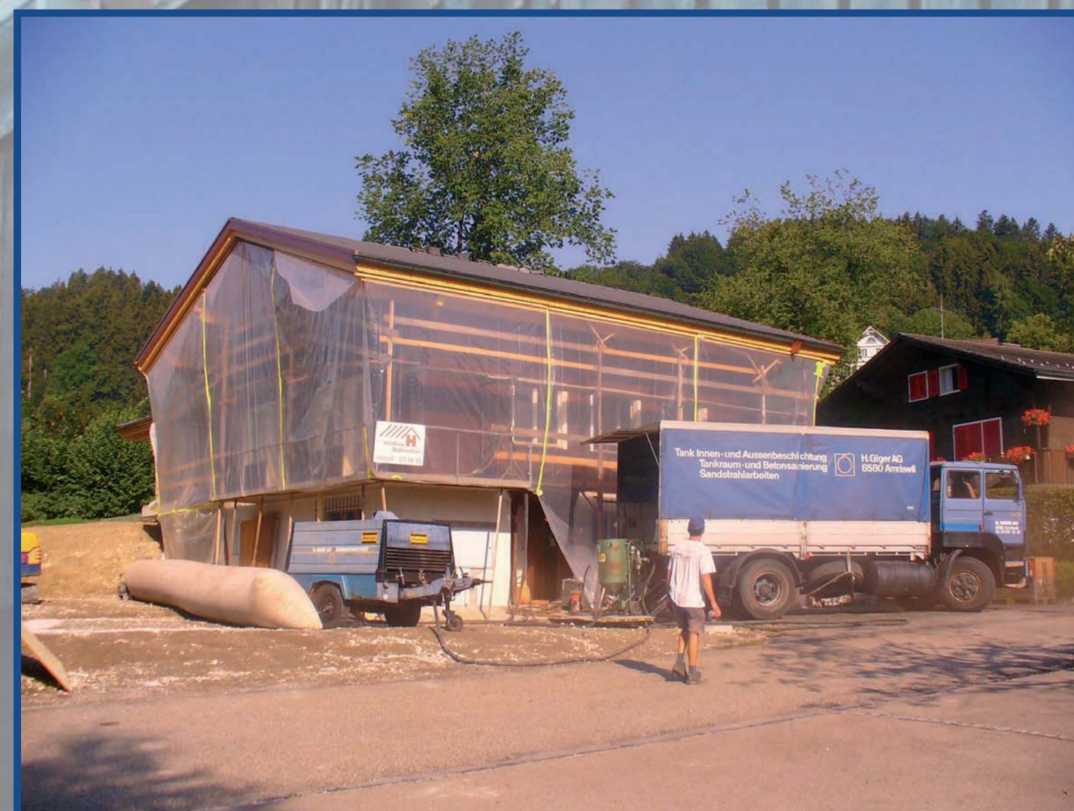
Das Haus wird staubdicht eingepackt