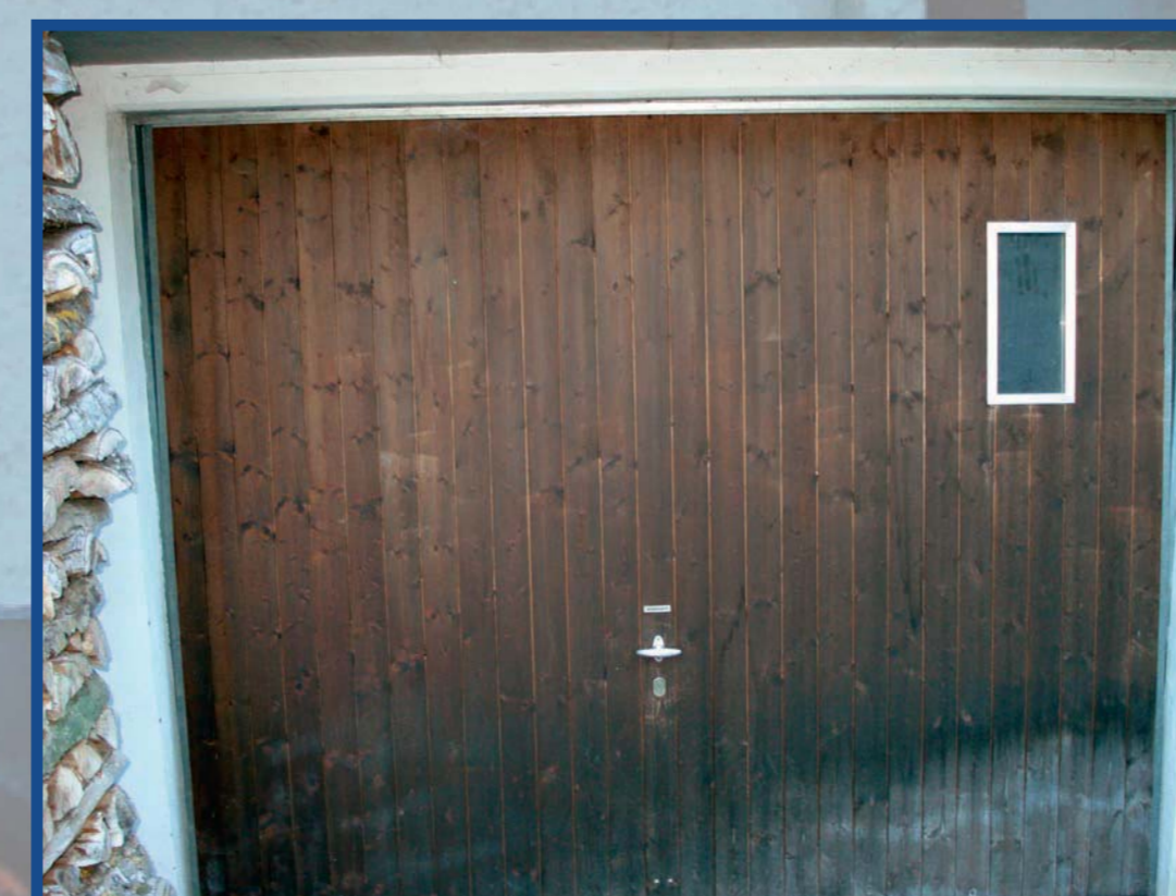
Detailvergleich vorher – nachher