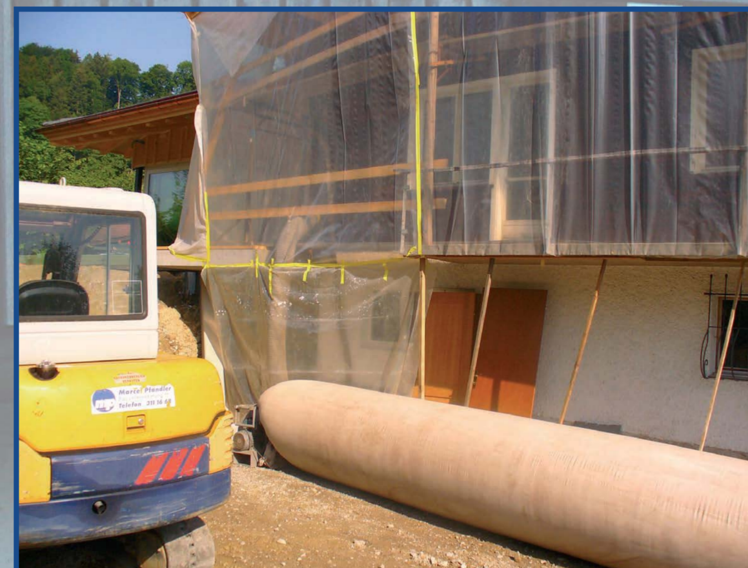
Mit einer Entstaubungsanlage wird abgesaugt