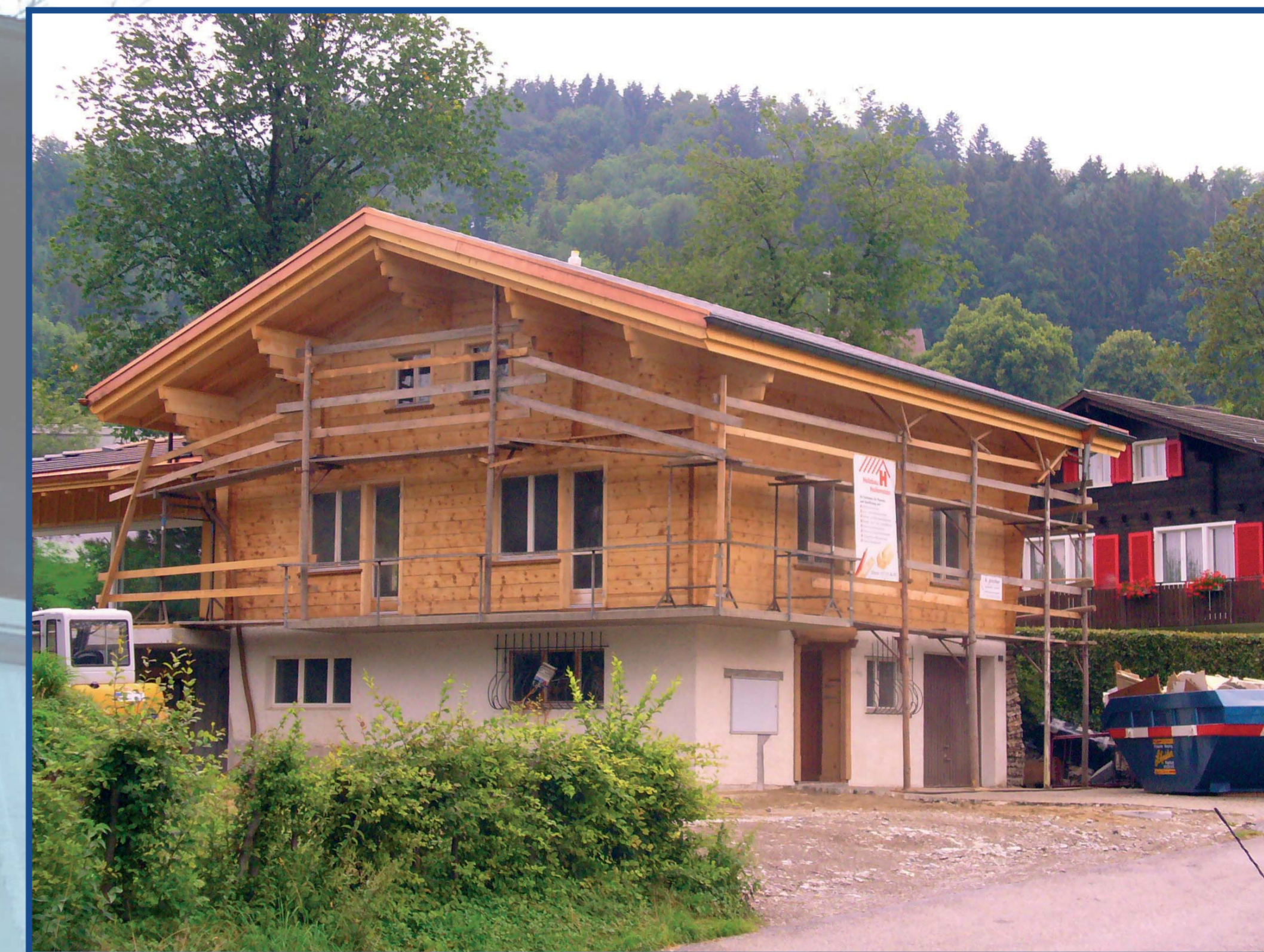
Das Haus nach der Sandstrahlung